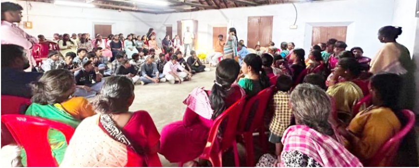
(Photo: YCS 2 nd Stage intensive training programme – Field visit to Sweepers colony at Krishnankovil)