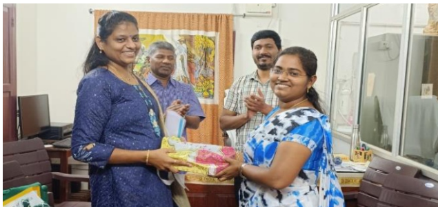
(Photo: Mrs. Ansaline took charge as the new secretary of commission for inter faith)